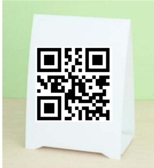
三角POPのイメージ。 誘導用QRコードを掲載。