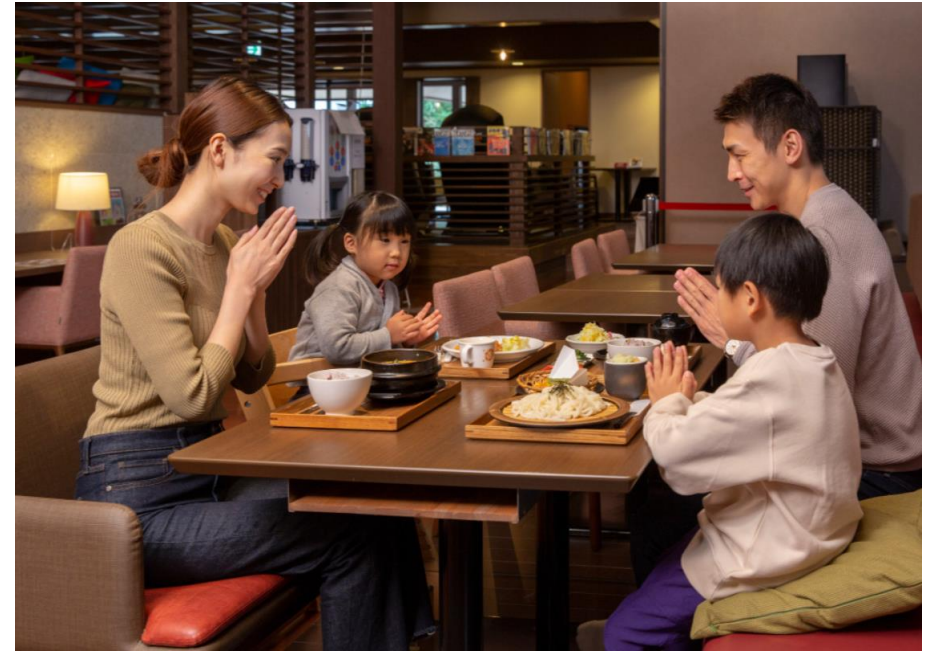
温浴施設「OYUGIWA」のお 食事処