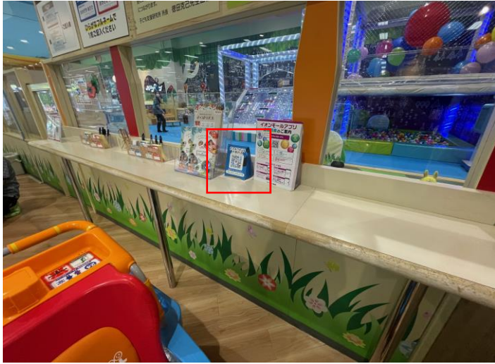
保護者が待機できる時間制 施設「スキッズガーデン」 の場外