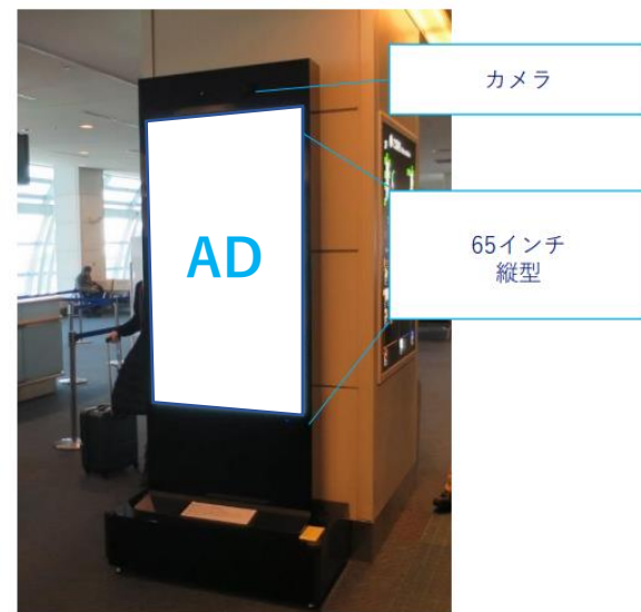
※上記は羽田空港の設置写真です