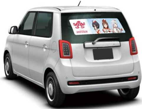
アイドルマスター：バンダイナムコエンターテインメント