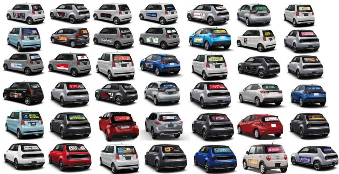
街中に走るキャンペーン車両